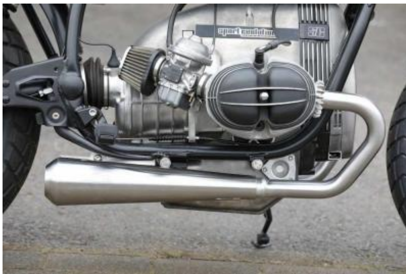
Anbau zeigt die rechte Seite, links ist entsprechend zu montieren